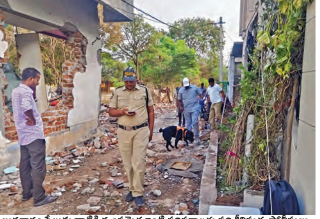
బుధవారం పేలుడు ధాటికి ధ్వంసమైన ఇంటి పరిసరాలను పరిశీలిస్తున్న పోలీసులు